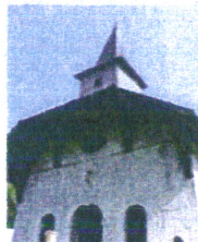
Vigny rénovée en 2000