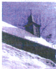
Mathonex clocher restauré en 2007