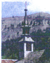
Chantemerle restaurée en 2007