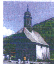
Vallons travaux été 2011