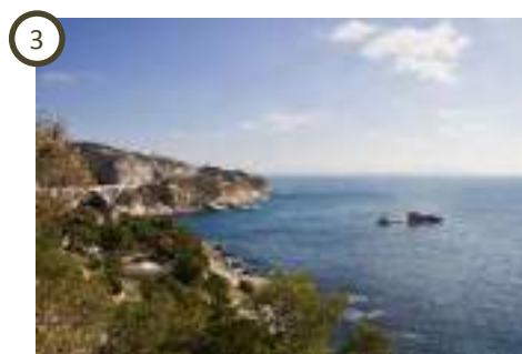
Vue panoramique Le Grand Mornas – Carry-le-Rouet