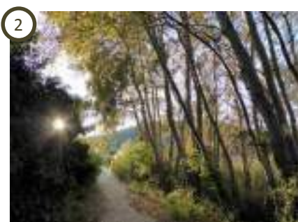
Roselière du Grand Vallat – Sausset-les-Pins