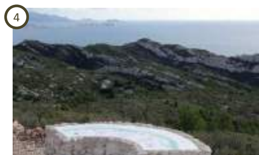
Table d'orientation des Caucarières - Ensues