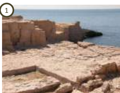
Les carrières de la pointe de Baou Tailla – Carro