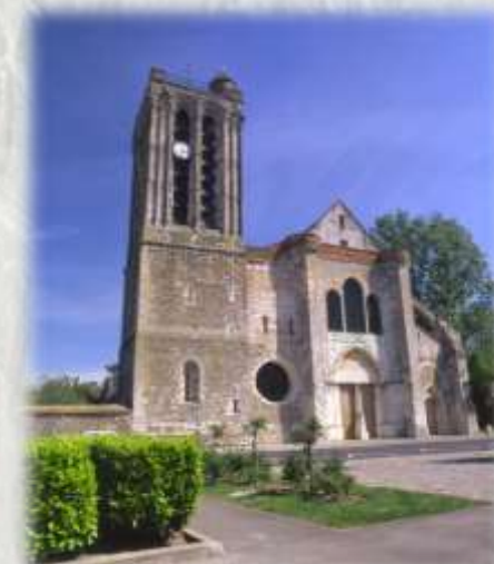
Collégiale Saint Martin de Champeaux

Le val d'Ancoeur est riche en édifices historiques, les plus réputés étant le château de Vaux-le-Vicomte et la collégiale de Champeaux. Ce circuit permet de voir le château fort de Blandy-les-Tours, le château de Bombon et Champeaux.