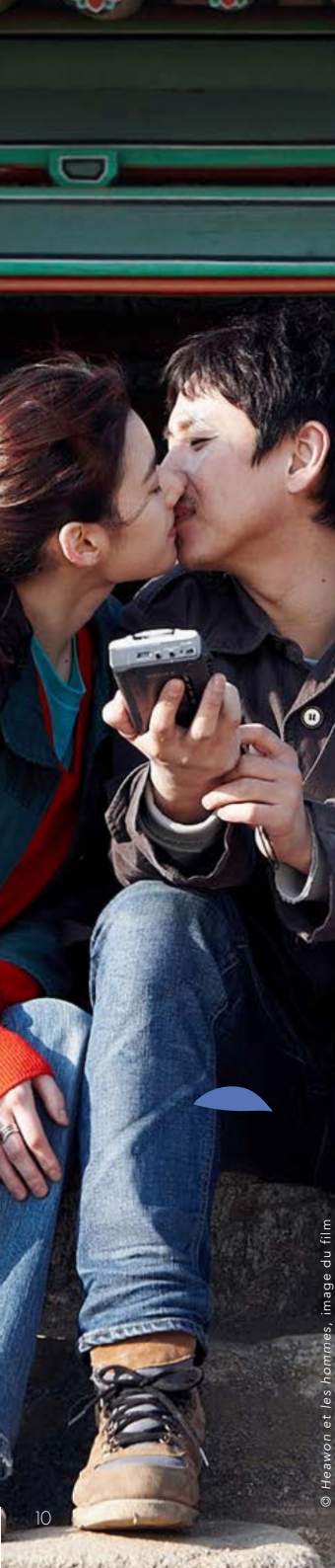
© Heawon et les hommes, image du film