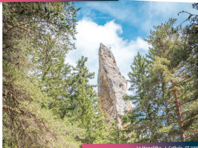
Le Monolithe - J. Cathala, OT HMV

Un goûter bien mérité pour petits et grands vous offre une pause hors du temps.