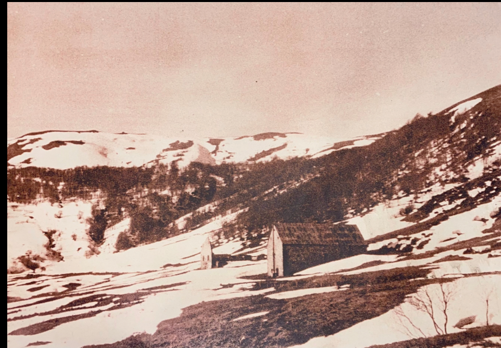
Photographie originale du buron de la mémé Joe

CHEZ MÉMÉ JOE, ON TRAVAILLE EN CIRCUIT COURT. UN MAXIMUM DE NOS MATIÈRES PREMIÈRES PROVIENNENT DE PRODUCTEURS LOCAUX, ET SONT CUISINÉES DANS LE RESPECT DES TRADITIONS DE CHAQUE RECETTE ORIGINALE.