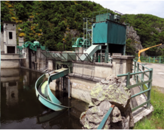
L'ascenseur et le toboggan pour la montaison du saumon