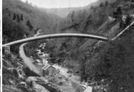
Construction du pont siphon