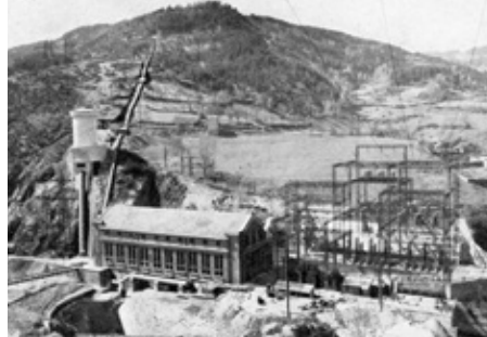
L'usine de Monistrol dans les années 40