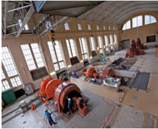
Intervention sur un groupe horizontal de la chute Ance du Sud