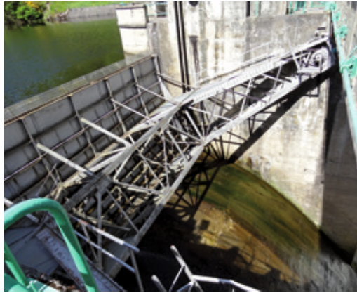
Vanne centrale du barrage de Poutès