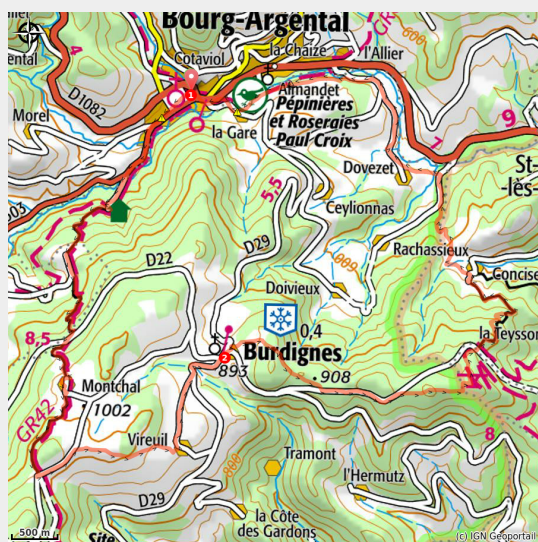
Vallée de la Déôme