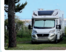
Emplacements & mobile homes