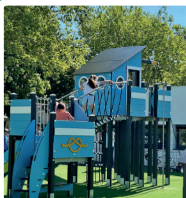
Aire de jeux