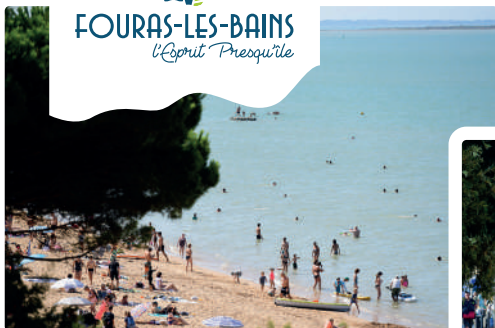
Front de mer