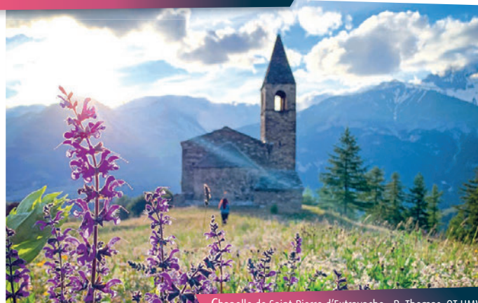
Chapelle de Saint-Pierre d'Extravache

Au retour, ne manquez surtout pas la vénérable église romane de Saint-Pierre d'Extravache, dont les origines remontent au 12 e siècle. Considérée comme le premier lieu de chrétienté en Savoie, elle mérite assurément le détour !