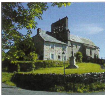
L'église romane de St-Rémy avec clocher peigne

Bien présente dans les rivières du secteur, ces truites sauvages et méfiantes sauront déjouer les pièges des pêcheurs qui devront s'armer de patience, mais ils ne reviendront jamais bredouilles car si le poisson n'est pas au rendez-vous, ils auront pu profiter des magnifiques paysages dans une nature encore sauvage.