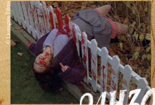
Séance sponsorisée par Puzzle Animations

SOIRÉE GRINDHOUSE «GARE AUX GAROUS» 1 ticket = 2 films