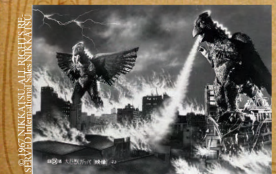
© 1967 NIKKATSU, ALL RIGHTS RESERVED International Sales NIKKATSU

GAPPA (DAIKYOJU GAPPA) Haruyasu Noguchi - Japon / 1967 / 1h23 Avec Tamio Kawachi, Yoko Yamamoto, Kōji Wada