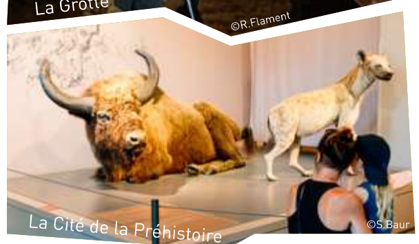
La Cité de la Préhistoire