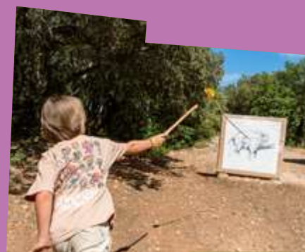
Atelier chasse