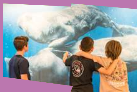
Belles Bêtes !