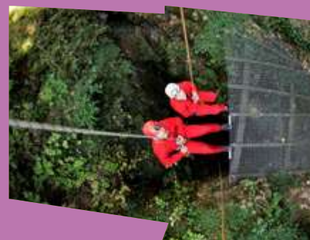
Descente panoramique

>>Public sportif. Sur réservation uniquement, groupe limité ( 6 à 8 personnes). Infos & résas : 04 75 38 65 10