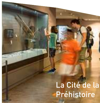
La Cité de la Préhistoire