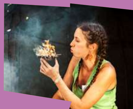
Les secrets du Feu