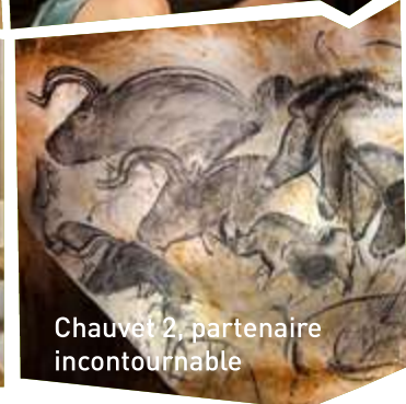
Chauvet 2, partenaire incontournable