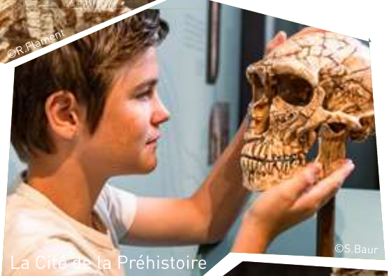
La Cité de la Préhistoire

>> Visite libre de la Cité de la Préhistoire, prévoir entre 45 min et 2h.