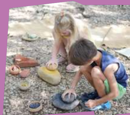
Atelier Créa'Magnon