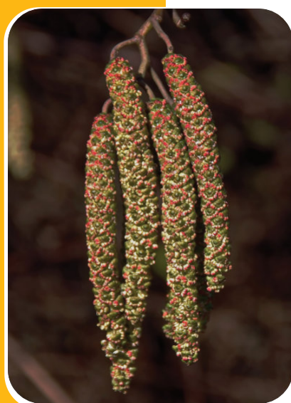
Chatons de l'aulne

Cet arbre vous accompagnera durant toute la première partie de votre circuit. Tout d'abord, sachez que l' Aulne glutineux s'installe toujours en bordure d'un ruisseau ou d'une rivière, permettant ainsi de consolider les berges. Son autre particularité se situe dans ses racines, à partir desquelles se développent des « nodules » qui possèdent la propriété, comme les légumineuses, de fixer l'azote de l'air, enrichissant ainsi le sol sur lequel il pousse. Ses fruits , les strobiles , ressemblent à de petits cônes de pins bien visibles en hiver lorsque les feuilles sont tombées. Enfin, vous aurez peut-être le bonheur d'observer les gourmands Tarins des aulnes qui, de passage chez nous en hiver, se nourrissent de ses abondantes graines.