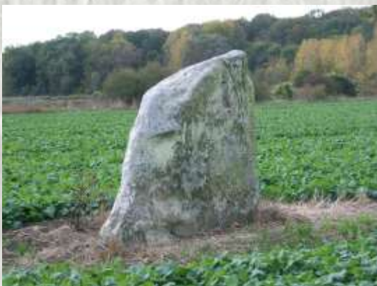
Pierre Couvée, menhir Courtomer

Le menhir, ayant échappé aux diverses menaces de destruction depuis 50 siècles, fut classé Monument Historique le 5 janvier 1971.