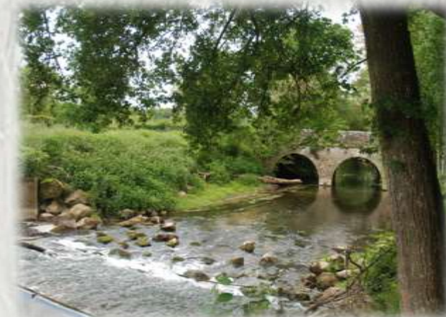
L'Yerres avant Argentières

Ce parcours vous permettra de découvrir la vallée de l'Yerres et quelques villages briards loin de l'agitation moderne.