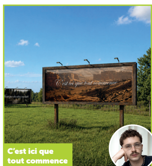
C'est ici que tout commence

La rénovation du lavoir communal de Les Bordes Aumont en 2025 a affirmé sa valeur patrimoniale et historique. L'œuvre « Buée » conçue dans ce contexte, se déploie sous charpente dans les reflets du bassin. La structure hélicoïdale gainée de tissu blanc translucide évoque la mémoire du lieu.