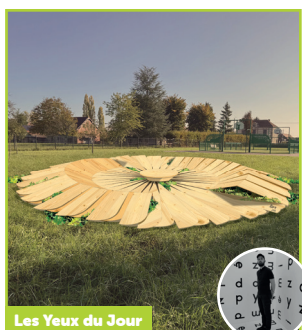
Les Yeux du Jour

Inspirée du conte iranien du géant endormi, l'œuvre « Borzandar, Le sommeil du géant » évoque l'union et la fragilité de la nature face à l'emprise humaine. Cette installation monumentale en terre et broyat, symbolise la conscience écologique et une nature protectrice et vivante.