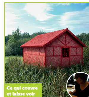
Ce qui couvre et laisse voir

Avec « C'est ici que tout commence », Corentin Darré installe dans le paysage des panneaux sculpturaux inspirés de l'affichage publicitaire. Habités par des images 3D et des slogans, ils transforment le territoire en un décor étrange et l'ouvrent ainsi à une expérience poétique.