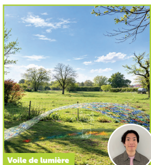
Voile de lumière

« Wind, des habitats volés par le vent », interroge la fragile relation entre l'être humain, son habitat et le territoire qu'il occupe. L'œuvre évoque, aux yeux de l'artiste, une architecture déracinée, comme saisie par une tempête soudaine. Une image à la fois poétique et instable, qui fait écho aux nouvelles violences climatiques traversant certaines régions du monde.