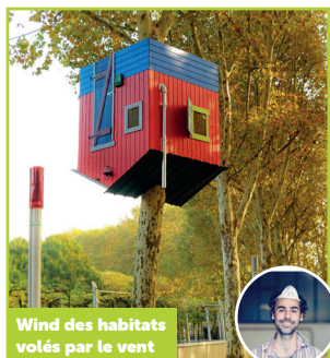
Wind des habitats volés par le vent

L'œuvre baptisée « Les Yeux du Jour » (Oxeye Daisy) s'inspire de la marguerite qui offre au spectateur une forme de reconnexion à la nature, conçue comme un réceptacle qui l'invite à créer son propre cocon. Une parenthèse dans un monde où la vitesse et le stress ont pris le pas sur l'apaisement et l'épanouissement.