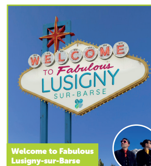
Welcome to Fabulous Lusigny-sur-Barse

Une dentelle rouge monumentale enveloppe le lavoir comme une peau légère et vibrante. Entre textile et architecture, le tissu transforme la structure en surface ajourée et entre en résonance avec la fonction originelle du lieu, laissant filtrer la lumière et le regard. L'œuvre évoque la fragilité, la mémoire des gestes, l'intime et le collectif. Elle affirme par le rouge une présence vivante et intense dans l'environnement.