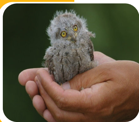
Petit duc immature