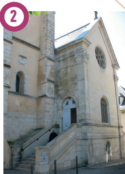
2 Eglise Saint-Médard, 14 rue Monmartel, Brunoy Située à l'emplacement d'une chapelle mérovingienne, l'église actuelle est classée au titre des Monuments historiques. La partie la plus ancienne est située au sud de la nef date du XII e siècle tandis que le chœur, voûté sur croisées d'ogives asymétriques, est du XIII e siècle, la tour des cloches et la partie nord du XVI e .