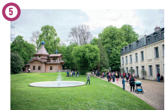
5 Séminaire Orthodoxe russe, 4 rue Sainte-Geneviève, Brunoy Depuis 2009, un séminaire de l'Eglise orthodoxe du Patriarcat de Moscou s'est installé dans la Maison Sainte-Geneviève, grande bâtisse du XVII e entourée d'un parc arboré de 4 hectares. La chapelle est décorée, des murs au plafond, de splendides fresques de style byzantin-russe uniques en France.