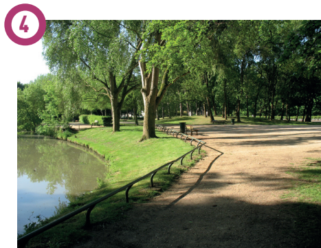
4 Parc Reigate & Banstead, 7 avenue Pierre Prost, Brunoy Le Parc Reigate & Banstead, est situé en rive gauche de l'Yverres. Hâvre de paix et de tranquillité au pied de la ville, bordé par la rivière et une zone boisée, ce parc atypique est ponctué d'étangs, mares et bras d'eau qui accueillent une faune et une flore caractéristiques des milieux humides. Il jalonne le Fil vert, promenade incontournable le long de l'Yverres et trait d'union naturel entre sept communes du Val d'Yverres Val de Seine.