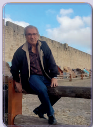
Pierre Mauméjean Maire d'Aigues-Mortes