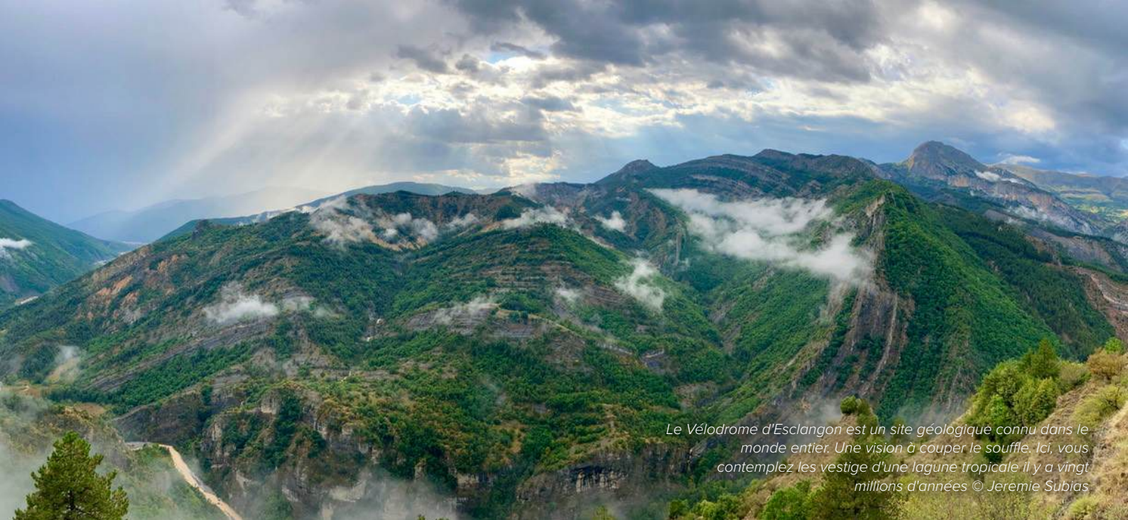
Le Vélodrome d'Esclagon est un site géologique connu dans le monde entier. Une vision à couper le souffle. Ici, vous contemplez les vestige d'une lagune tropicale il y a vingt millions d'années