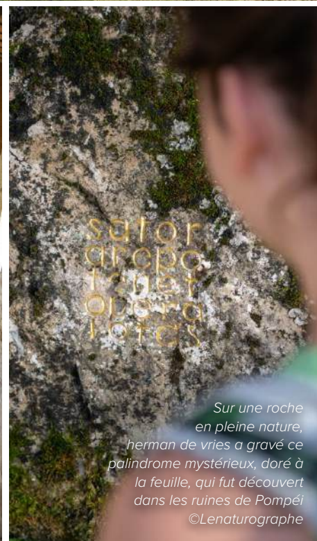
Sur une roche en pleine nature, herman de vries a gravé ce palindrome mystérieux, doré à la feuille, qui fut découvert dans les ruines de Pompéi