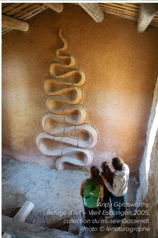
Andy Goldsworthy, Refuge d'Art – Vieil Esclagon, 2005, collection du musée Gassendi.