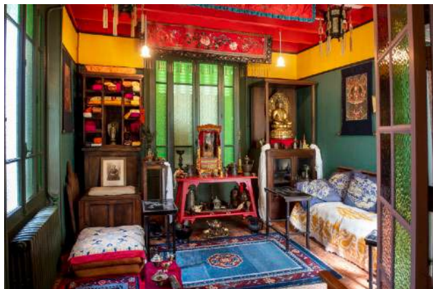
Ci-dessus : Alexandra David-Neel Maison Alexandra David-Neel, département des arts asiatiques du musée Gassendi