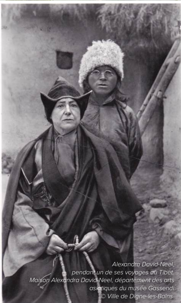
Alexandra David-Neel, pendant un de ses voyages au Tibet.