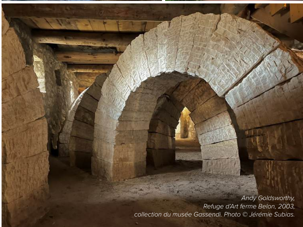
Andy Goldsworthy, Refuge d'Art ferme Belon, 2003, collection du musée Gassendi.