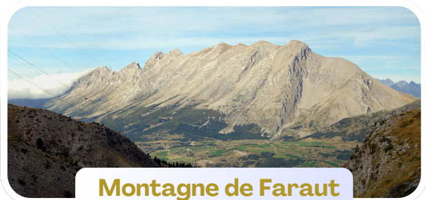
Montagne de Faraut

Massif resté à l'écart des grand flux touristiques et de circulation, le Dévoluy est particulièrement préservé et sauvage, isolé par ses bastions minéraux que sont le Pic de Bure, le Grand Ferrand et la Grande Tête de l'Obiou, entre Préalpes et Ecrins. Votre randonnée débute dans l'exceptionnel vallon de la Jarjatte, avant de rejoindre le cœur du massif, puis d'aborder le plateau de Bure et ses radars insolites, et de renouer avec la forêt méridionale des Sauvas. La traversée de villages oubliés et les nuitées en maisons forestières vous feront définitivement vibrer !