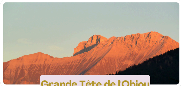
Grande Tête de l'Obiou