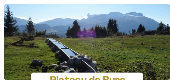
Plateau de Bure