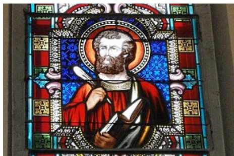
Office de Tourisme de Douvaine

L'année 1883 voit l'achèvement de la chapelle St François de Sales, qui sera bénie le 14 octobre par Mgr Soubiranne, évêque de Belley.