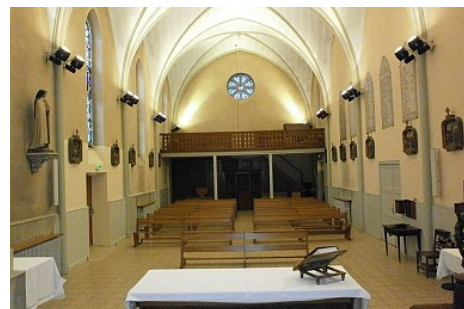
Office de Tourisme de Douvaine