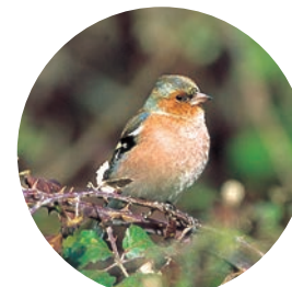
Pinson des arbres

Plusieurs mares, au nord du boisement, constituent des zones humides appréciées des amphibiens (crapauds communs, grenouilles agiles et tritons palmés) et des insectes (libellules, coléoptères...).