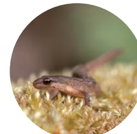
Triton palmé