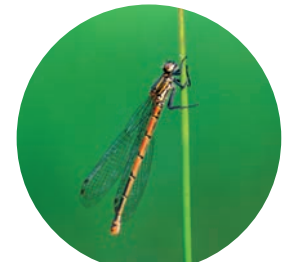
Nymphe au corps de feu