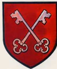
ARMOIRIES DE PROPRIÉTAIRES SOUS L'ANCIEN RÉGIME