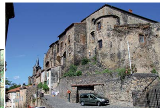
Lamothe et son imposant château médiéval présenté p. 32-33.

ruines de la chapelle Saint-Laurent, ancienne digue). 7 Après le village, au carrefour, prendre à gauche la large piste vers Lamothe. 8 Traverser la D 16, monter par un sentier qui passe sous le château, puis regagner la place par les ruelles du vieux bourg.