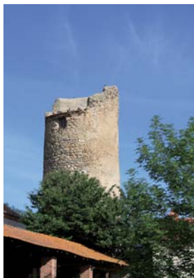
La tour-pigeonnier à Ouilandre.

Durée : 0 h 45 Dénivelée : 40 m Niveau : très facile. Difficultés : montée 150 m après 4. Descente 150 m avant 5. Danger : traversée de la D 14.