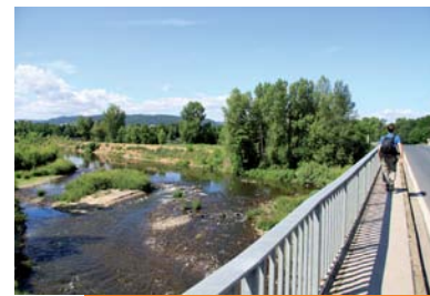
L'Allier au pont de Lamothe.