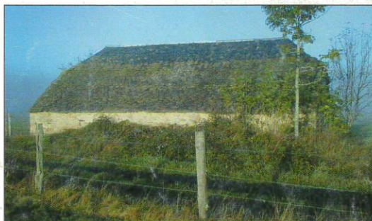
Une des granges du plateau que l'on appelle ici "lôu mazuc"

Composées de graminées et légumineuses (agrostis grêle, fétuque rouge, trèfle rampant ainsi que d'achillée millefeuille, lotier corniculé, betoine officinale et autres scabieuses ou compagnons rouges) les prairies actuelles assurent grâce à leur grande variété un foin excellent. On dit même que la gentiane (la grande gentiane jaune) dont les vaches consomment seulement la fleur prodiguerait un goût particulier au lait des vaches.