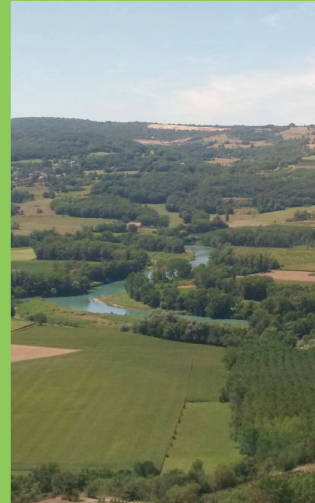
Le fleuve Rhône naturel