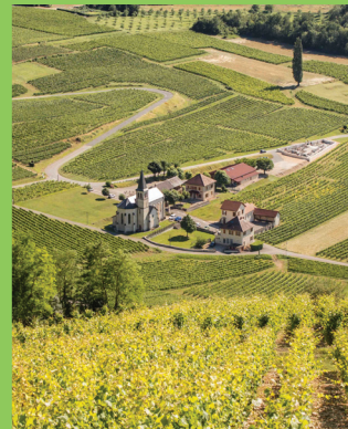
Eglise Saint-Maurice et son vignoble.