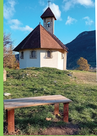
Chapelle Saint-Romain.

Office de Tourisme de Yenne et sa Région tél. 04 79 36 71 54 · yenne.tourisme@orange.fr www.yenne-tourisme.com