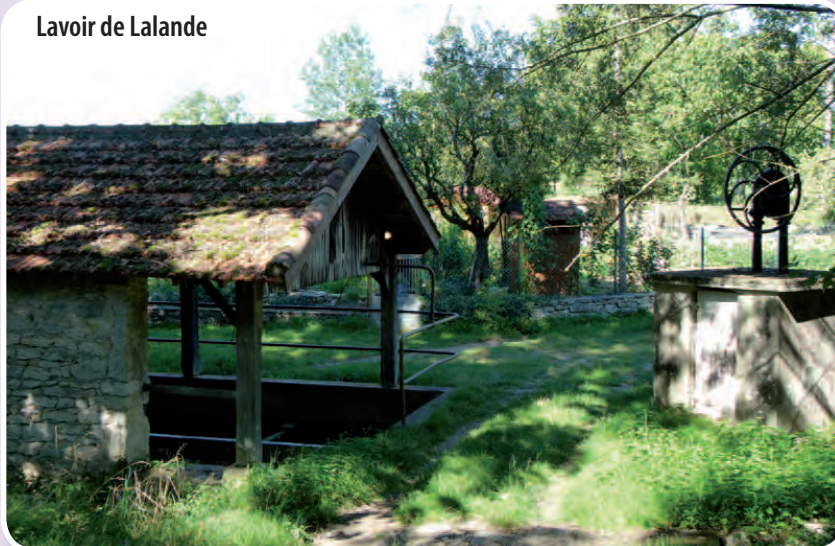
Lavoir de Lalande

■ Prenez direction Cayriech : 2 pigeonniers tour. Après 1km, empruntez le chemin de terre à gauche, au milieu des prairies puis des sous bois. Au croisement, pour rejoindre «Fustié», à droite le sentier bordé de murs en pierres sèches. En sortant du couvert, après «Couvent», à droite, point de vue sur Puylaroque. Au carrefour de « Fustié », prenez à gauche la route goudronnée : à 200m environ, à droite, un pigeonnier pied de mulet, devenu habitation. Au croisement, engagez-vous sur le chemin de terre quasiment en face (au carrefour de Cayriech, à droite, imposante croix). A gauche, dans le pré, une maison en pierre avec grange. Puis, tout droit, par un sentier à couvert, pendant 800m.