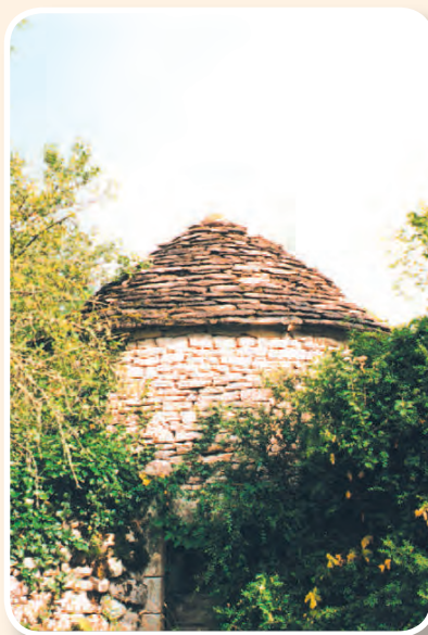
▲ Gariotte «La Mandine»

Après 1km environ, tournez à gauche et admirez le corps de ferme « La Loge » pour revenir sur vos pas, direction « Cluzel ». Au calvaire, prenez à droite pour rentrer à Lavaurette.