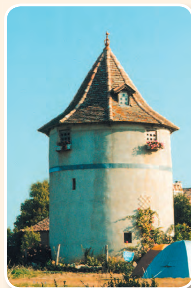
▲ Pigeonnier tour à «Saillac»