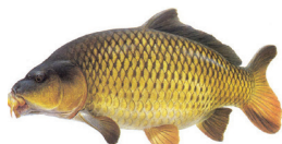
6 La carpe