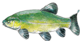
1 La Tanche