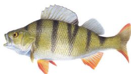
5 La perche commune