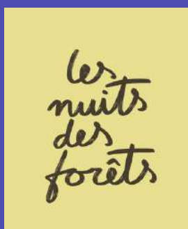
Site Nuits des Forêts

Notre communication est prévue au travers de médias locaux et institutionnels, comme les médias de la ville de Versailles, du département ou de la région. Nous avons également pu nouer des liens avec quelques influenceurs locaux l'année dernière sur les réseaux sociaux.