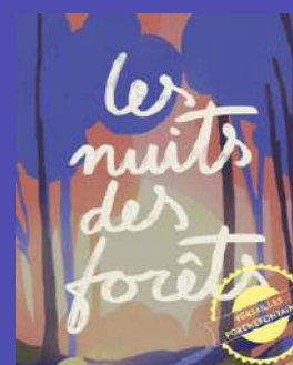
Flyers 2000 ex à distribuer

Au regard de notre première participation et de la programmation proposée pour l'édition 2026, entre 400 et 650 personnes devraient nous rejoindre pour participer aux ateliers.