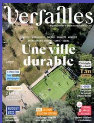
Magazine de la ville