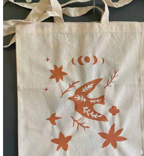
1. Pochoir sur tote bag par le studio bonne impression. 2. Démonstration du jeu de la Mérelle romaine.

Enfants de 4 à 6 ans accompagnés d'un adulte Plein tarif enfant 8€ // Tarif réduit enfant 6€ // Adulte accompagnant gratuit