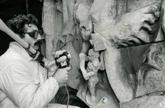
1. Restauration de la Maison des Têtes en 1995. Valence