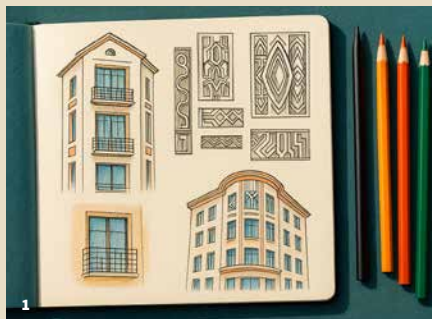
1. Croquis de façades et décors Art Déco

Un parcours à la découverte de ce courant d'architecture des années 1920-1930 qui se matérialise dans les rues de Valence et Romans par des décors et des matériaux caractéristiques : formes géométriques élancées, usage du béton, ornements stylisés des façades.