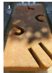
1. Stèle de la commémoration du génocide arménien. Romans

Explorez la vieille ville de Romans ! Cette visite propose une flânerie dans les rues, les places et dans les belles demeures du centre historique. Découvrez les monuments emblématiques de l'histoire et du patrimoine romains dans une ambiance conviviale et enrichissante.