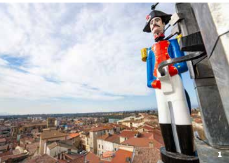
1. Le bonhomme Jacquemart sonnant sa cloche. Romans 2. Démonstration de l'atelier « petit bâtisseur ».

Visite à partir de 6 ans – enfants sous la responsabilité de leur accompagnant Tarif adulte 6€ // Tarif réduit adulte 4€ // Tarif enfant 4€