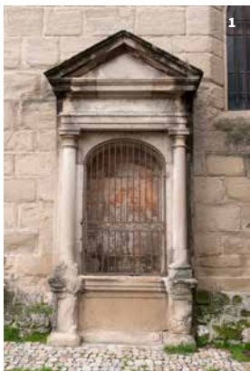
1. Station du chemin de croix. Romans