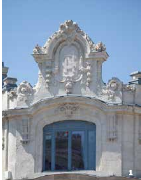
1. Détail de la façade des Nouvelles galeries. Valence 2. Portrait de Madame de Flandreysy, Louis Ollier, D. 189, coll. Musée de Valence arts et archéologie

Rendez-vous Maison des Têtes, Valence Partez à la découverte de Valence à la Belle Époque. Plongez-vous dans le quotidien d'une ville en pleine effervescence ! Il fait bon vivre en cette période de paix et de prospérité marquée par l'essor des arts, des grands magasins et par la modernisation de la ville. Découvrez les lieux qui faisaient alors l'orgueil des Valentinois.