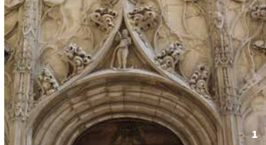
1. Linteau ornementé de la Maison des Têtes. Valence 2. La cité-jardin de Valensolles à la fin des années 1930. Valence

Rendez-vous Maison des Têtes, Valence Partez à la découverte du centre historique de Valence ! Cette visite vous guidera parmi les monuments emblématiques de la vieille ville : la majestueuse cathédrale Saint-Apollinaire, la Maison des Têtes, la Maison Dupré-Latour, le temple Saint-Ruf, la Maison mauresque et la pittoresque place Saint-Jean. Un parcours où l'histoire se dévoile à travers le charme de Valence.