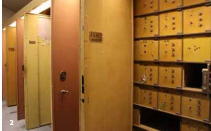
2. Anciens coffres-forts particuliers de la Banque de France. Valence