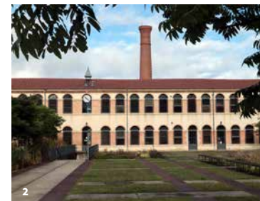
2. La Cartoucherie. Bourg-lès-Valence

Rendez-vous Parvis de la collégiale Saint-Barnard, Romans