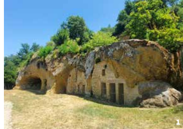
1. Site troglodytique. Châteauneuf-sur-Isère