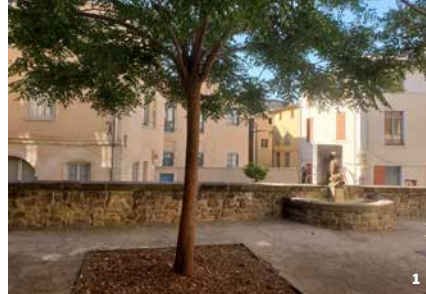
1. Place Macel. Romans 2. Détail de la façade du cercle militaire. Romans