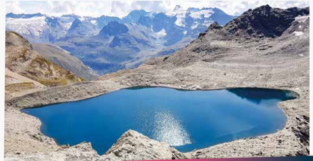
Le lac des Fours

Le lagopède est homochrome. Il a cette magie dans le plumage qui lui permet de se confondre à son milieu. Pour se camoufler au quotidien, il mue 3 fois par an et change de parure l'été, l'automne et l'hiver.