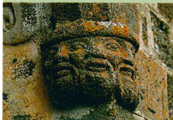
Détail de l'église de Gourdièges (Xe s)

Cette randonnée familiale emprunte de bons chemins, sans aucune difficulté. Une partie du circuit se fait en sous-bois et l'autre à découvert, pour offrir de beaux points de vue. On apprécie également son aspect instructif avec le sentier botanique dans le Bois de Chabridet.