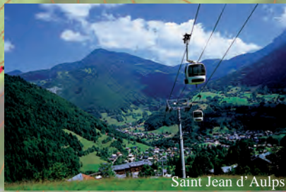
Saint Jean d'Aulps