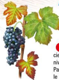
RAISIN GAMAY / DESSIN PR.

Au-dessus de Saint-Pourçain-sur-Sioule, la colline de Briailles surplombe la ville et ses alentours : vous serez au contact des bois et des vignes, tout en dominant une plaine immense.