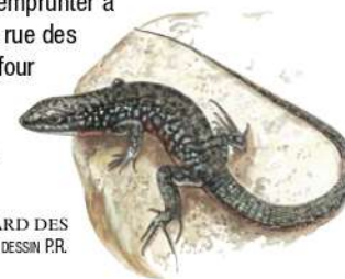
LÉZARD DES MURAILLES / DESSIN PR.

2 Tourner à gauche et retrouver le point de départ.