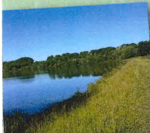
FFRandonnée Gers - Le lac de Saint-Martin