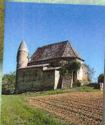
FFRandonnée Gers - Eglise de Mauriet

Situé à 6 km de Nogaro direction Riscle, vous randonnerez entre vignes et champs et découvrirez le lac (réserve d'eau pour l'irrigation), le château du XVI e siècle ainsi que les églises du village et de Mauriet. Vous marcherez également au bord de l'Izaute que vous traverserez 2 fois.