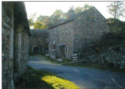
Maison traditionnelle au village de Chanteloube

rivière. Car des crues, LA TRUYERE en a connue et de mémorables. Sous le pont actuel, des repères datés marquent le niveau atteint par les eaux.