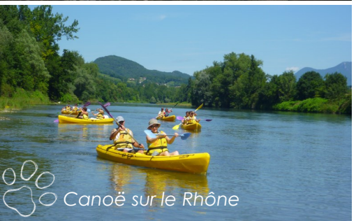
Canoë sur le Rhône