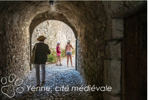
Yenne, cité médiévale