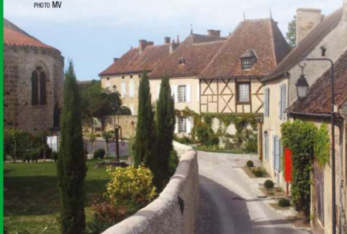
VIEUX VILLAGE DE VERNEUIL-EN-BOURBONNAIS