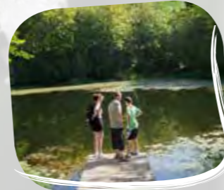
Sentier de la Beunaz

Visites guidées : Renseignements dans les bureaux d'information touristique : Bernex 04 50 73 60 72 Thollon 04 50 70 90 01 Visites pour les groupes toute l'année sur réservation.