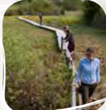
Le sentier du Maravant

Le plateau de Gavot, balcon du lac Léman , accueille une centaine de marais disséminés çà et là. Longtemps méprisés, parfois exploités, souvent redoutés, les marais sont le refuge d'une nature mystérieuse et sauvage. Aujourd'hui, les marais du plateau sont protégés et entretenus.