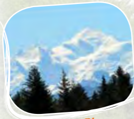
Le Mont Blanc

Facile d'accès, à pied, à vélo ou en voiture, ce splendide site est idéal pour une balade en famille. Vue exceptionnelle sur le Mont Blanc , le lac Léman , la Dent d'Oche et le Jura . Une table d'orientation vous permettra d'identifier les sommets sur 360°.