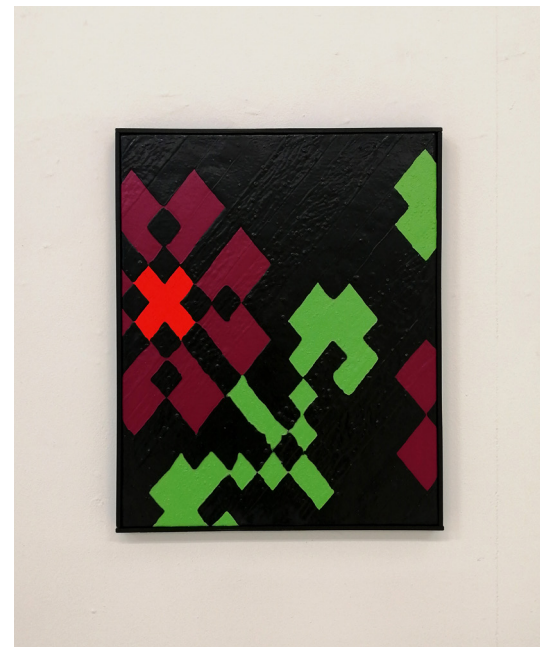
Les Diagonales, 2025 Acrylique sur toile 41 × 34 cm