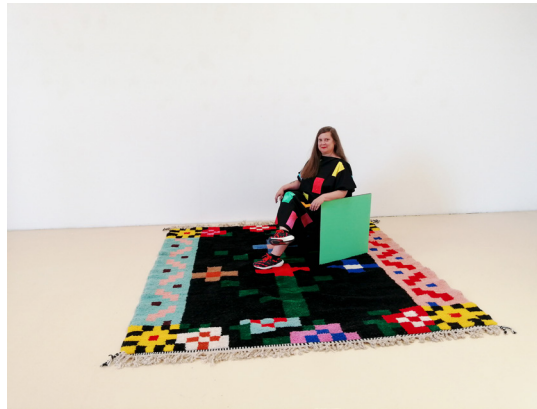
Vue de l'artiste à l'atelier, 2025