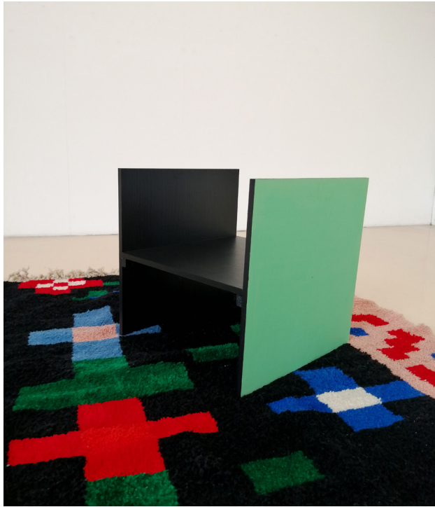
Module Sonia (coll. Painting For Living ), 2025