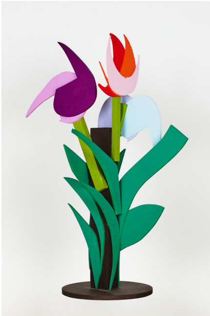
Leftovers (Futurist Wood Flower), 2006 Acrylique sur bois, colle et vis 105 × 60 × 75 cm