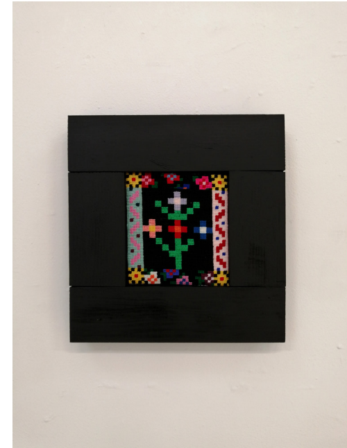
Tableau Pointilliste - Replica , 2024 Laine, aïda, bois et peinture 27,8 × 26,5 cm Courtesy de l'artiste et ADAGP 2025.