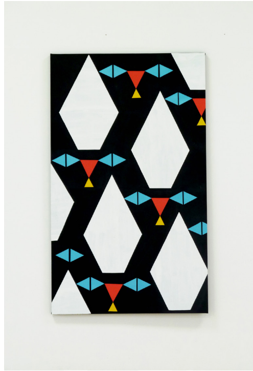
Cat's Eyes , 2011