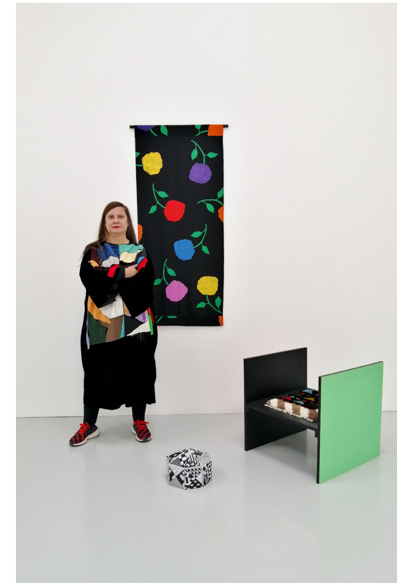
Vue d'atelier, déc. 2025

Site internet de l'artiste : http://karina.bisch.free.fr