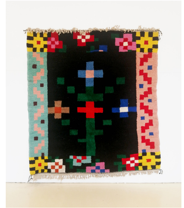
Tapis (coll. Painting for living ), 2025