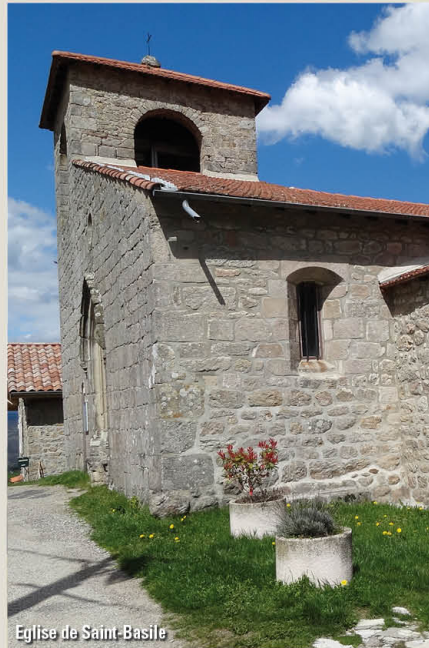
Eglise de Saint-Basile