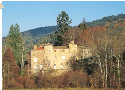
Implanté dans un site romantique, d'apparence massive, le château du Mas est flanqué d'une tour à canonnière et de tourelles évocatrices de la vie seigneuriale du XVI e siècle.

Partagée entre plateau et vallée, la balade présente deux visages : l'un ouvert sur les champs et les pâtures avec le Cézalier pour horizon, l'autre plus intimiste, camouflé sous les feuillages de la vallée du Ceroux, qui mène aux portes du château du Mas.