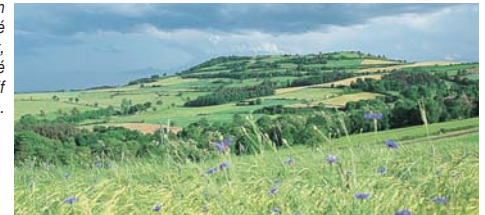
Le volcan de la Vergueur, cerné d'un camaïeu de vert, parfois rehaussé du rose vif des orchis.

lier et le Livra-dois-Forez. La suivre à droite. Descendre ensuite à gauche jusqu'à Verneuges. 5 Passé le hameau, descendre à gauche au niveau d'un puits avec un bac . À la route, suivre celle-ci à gauche. Au croisement, monter la D 52 à gauche. 6 Descendre à droite la première piste vers la source du Ténou . Descendre jusqu'au moulin de La Poudrière . 7 Traverser le Ceroux et monter à gauche dans la