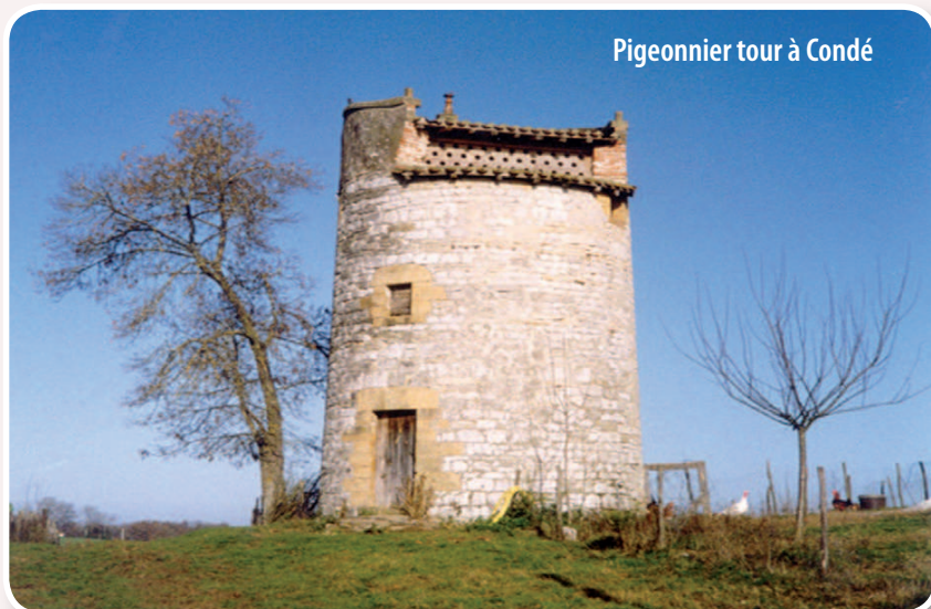
Pigeonnier tour à Condé

■ Avant de commencer votre randonnée, admirez le lavoir et le puits en pierre en bord de route puis passez entre le pigeonnier tour et clocheton restauré et l'église avec son petit clocher mur. Appréciez les belles maisons en pierre puis empruntez la route et, descendre un chemin sur la droite jusqu'à une pompe puis tournez à gauche le long des arbres pour remonter vers « Ratié ».