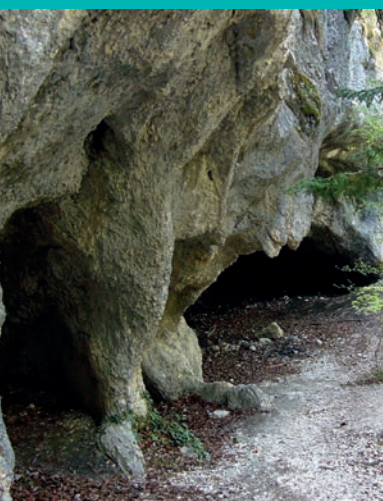
Grottes François 1er. www.sentier-nature.com