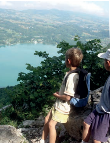
Au rocher du Corbeau.

En 1516, François 1er, premier fils de Charles d'Angoulême, Comte d'Orléans et de Louise de Savoie vint de Lyon à cheval par le col de Saint-Michel pour vénérer le Saint-Suaire alors exposé à la Sainte Chapelle de Chambéry. En revenant de son équipée, il fut surpris par un orage et se réfugia dans cette grotte qui porte son nom.