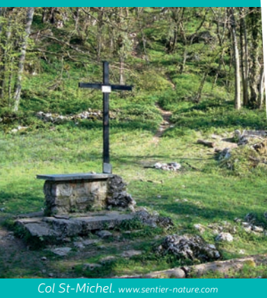
Col St-Michel. www.sentier-nature.com