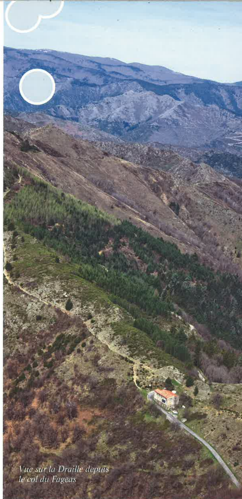
Vue sur la Draille depuis le col du Fageas