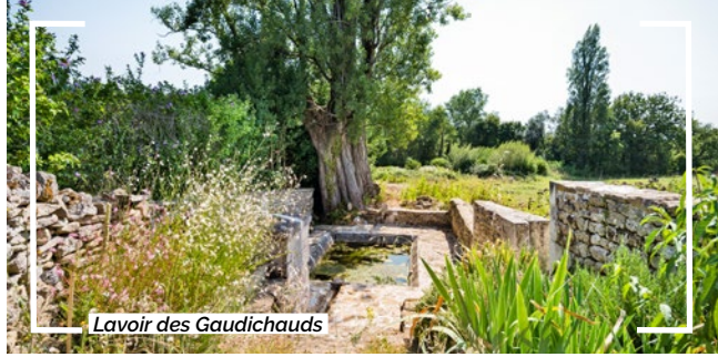
Lavoir des Gaudichauds

Poursuivre tout droit pour atteindre le hameau du "bois de Vot". Continuer sur cette même rue jusqu'au carrefour. Traverser la route pour s'engager en face sur le chemin blanc.