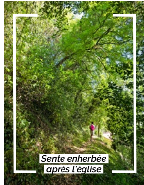
Sente enherbée après l'église

Descendre par les escaliers en pierre puis continuer quelques mètres vers la gauche sur la rue goudronnée.