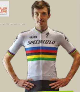
Jordan Sarrou, champion du monde 2020 et ambassadeur de notre espace VTT