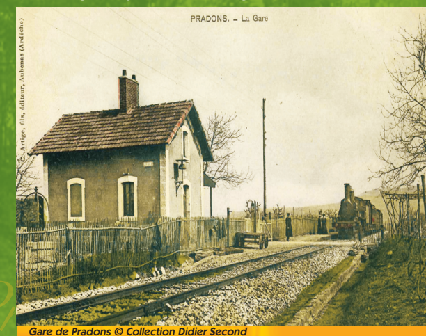
Gare de Pradons

La ligne du PLM (Paris-Lyon-Méditerranée), ouverte en 1876 a fait la fortune industrielle de Ruoms. On expédiait le velours, la bière et les blocs de pierre des carrières. La pierre arrivait sur des charrettes à très grandes roues et était chargée sur les wagons à partir d'un quai particulier. Le charbon qui arrivait en gare de Ruoms provenait de Gagnières (Gard). Après la Guerre de 1939-1945, la main d'œuvre des usines textiles s'y déversait dans un sens pendant que, dans l'autre sens, le « train des mineurs » se dirigeait vers les mines du bassin de Bessèges, aujourd'hui aménagée en Voie verte.