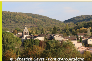
© Sébastien Gayet - Pont d'Arc-Ardèche

Départ : Pradons Coord. GPS : N44°28'31,1" / E4°21'35,9" Distance : 3,6km Durée : 1h15 Dénivelée cumulée : 64m Balisage : blanc et jaune (PR)