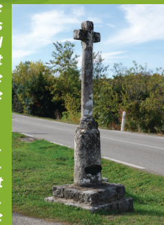
Croix des Peyrous

A Pradons, le milliaire Sud n° XX, transformé en calvaire, dit des Peyrous, se trouve à peu près à son emplacement d'origine. Son inscription reste lisible. Une plaque rappelant le niveau de l'inondation du 22 septembre 1890 oblitère le nombre de milles qui indique la distance de vingt milles correspond à 29,57 km depuis Alba.